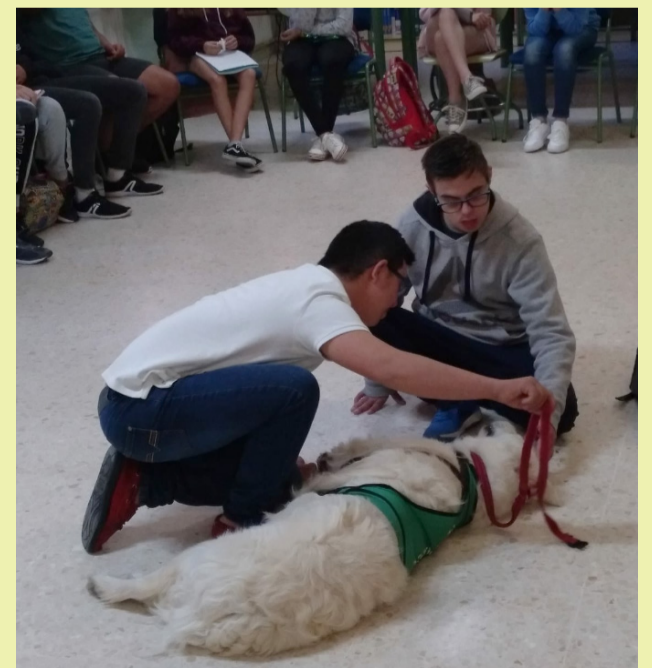
Alumnos del Aula Específica participando en la actividad formativa que se desarrolló en nuestro centro con la perra Playa.

E L alumnado del Aula Específica del IES La Arboleda participó de forma especial en las actividades de la campaña “Di no al maltrato animal”, involucrándose incluso en la confección de un panel ilustrativo. Desde estas páginas queremos hacerles llegar nuestra enhorabuena por su trabajo y su entusiasmo.