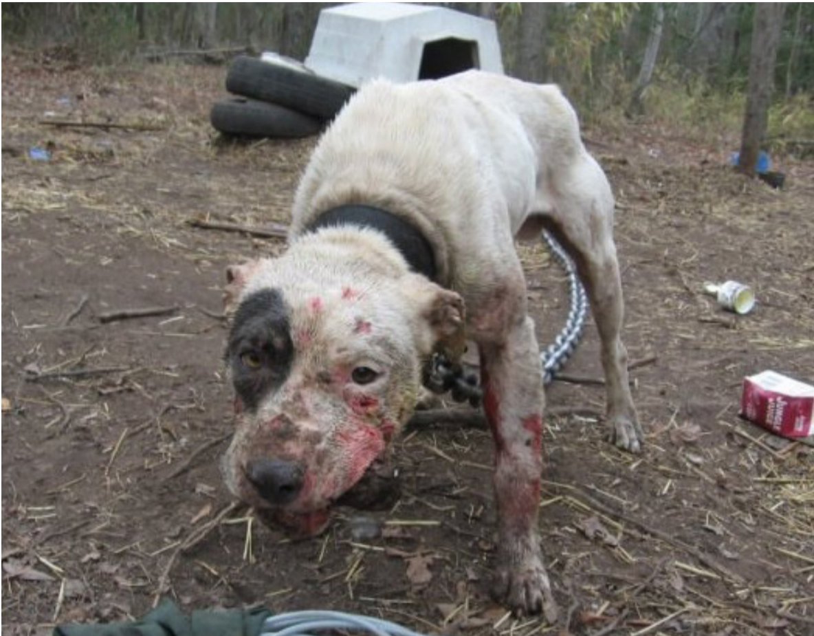
Imagen de un perro maltratado, obtenida de internet.